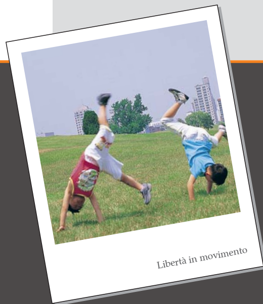
Libertà in movimento